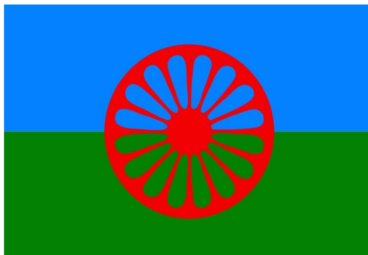
Bandeira Romani, criada em 1971, durante o I Congresso Mundial Romani. O azul simboliza o céu, o verde simboliza a terra e a roda, em vermelho, a liberdade. Os dizeres que inspiraram sua criação - “ O céu é meu teto, a terra minha pátria e a liberdade é minha religião ” - caracterizam o simbolismo desta Nação sem Território.

Ao longo das últimas duas décadas, esta data tem sido utilizada pelas organizações que se dedicam ao fortalecimento dos direitos dos povos romani (ciganos) e pelas pessoas de etnia romani (cigana) para promover eventos culturais, discussões e protestos com o objetivo de dar visibilidade às identidades e às múltiplas expressões culturais destes povos, bem como ao racismo e às graves violações de direitos humanos que os atingem.