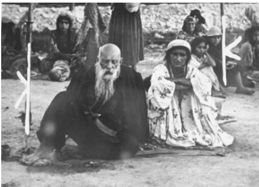
Campo de concentração de Auschwitz.

Ainda há uma enorme escassez de dados para dimensionar o alcance do Holocausto Cigano . Apenas em Auschwitz, o número de ciganos registrados chegou a 20.933, incluindo 360 crianças nascidas neste campo de concentração, e que viveram o bastante para receberem números de registro. A estes, se somam cerca de 1.700 rroma enviados para as câmaras de gás assim que chegaram ao campo, em março de 1943. Em um único dia - 29 de maio de 1943 - 102 ciganos foram arrastados para fora de suas instalações e levados para as câmaras de gás.