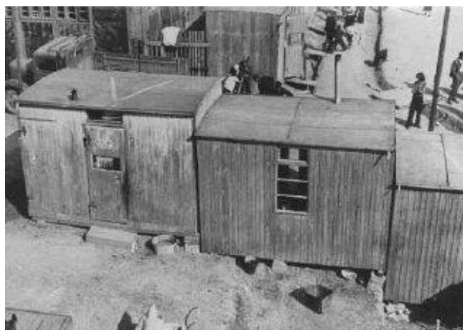
Campo de concentração de Auschwitz.