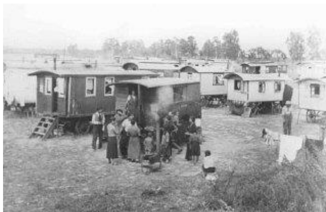
Campo de concentração de Auschwitz.