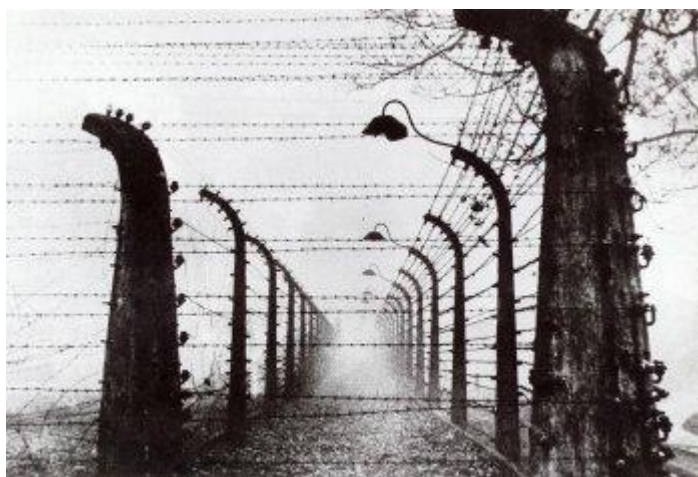
Campo de concentração de Auschwitz.

No período de 1941 a 1945, são inúmeros os testemunhos sobre massacres coletivos, mortes individuais, tortura de todo o tipo, experimentos químicos e médicos envolvendo os roma. Ações desta natureza foram realizadas em diversos campos de concentração: Auschwitz, Birkenau, Mauthausen, Rabensbruch, Buchenwald, Chelmo, Lodz, Dachau, Lackenbach e Sachsenhausen. Para Auschwitz, foram enviados roma de diferentes nacionalidades, inclusive soldados alemães em licença da frente militar, alguns deles condecorados por bravura em combate.